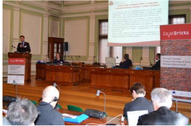
Konferencja „Cool Bricks – Zmiany Klimatyczne a Dziedzictwo Kulturowe i Efektywność Energetyczna Zabytków”

W Gdańsku, w Nowym Ratuszu, 16 kwietnia 2012 r. odbyła się międzynarodowa konferencja zorganizowana przez Europejską Fundację Ochrony Zabytków, pod honorowym patronatem marszałka województwa pomorskiego. To jeden z elementów projektu „Cool Bricks – Climate Change, Cultural Heritage & Energy Efficient Monuments” („Cool Bricks – Zmiany Klimatyczne a Dziedzictwo Kulturowe i Efektywność Energetyczna Zabytków”).