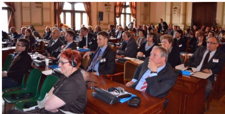
Konferencja „Cool Bricks – Zmiany Klimatyczne a Dziedzictwo Kulturowe i Efektywność Energetyczna Zabytków”

Uczestnicy konferencji, pochodzący z wszystkich krajów basenu Morza Bałtyckiego, prezentowali przykłady renowacji budownictwa ceglanego w ich krajach. Okazało się, że poszczególne państwa mają w tej kwestii różne doświadczenia i poglądy.